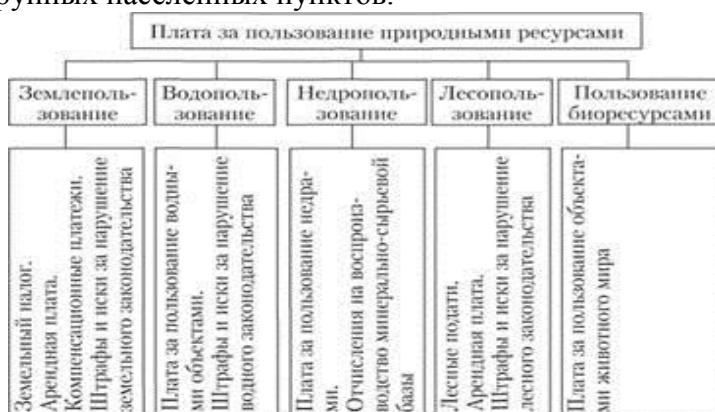
Рис. 10.8. Структура платы за природные ресурсы

Формами платы за землю являются: арендная плата, земельный налог. Размер арендной платы за землю устанавливается договором. Размер земельного налога не зависит от результатов хозяйственной деятельности и устанавливается в виде стабильных платежей за единицу земельной площади в расчете на год. При формировании бюджетной системы РФ производится регулярный пересчет земельного налога с учетом индексации ставок. Ставки земельного налога определяются отдельно по категориям земель основного целевого назначения, видам и подвидам угодий, природным зонам, группам почв, городам, поселкам, зонам крупных населенных пунктов.